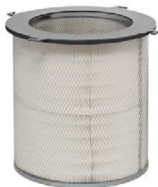
Фото 3: сменный фильтровальный картридж для METEOR Profi