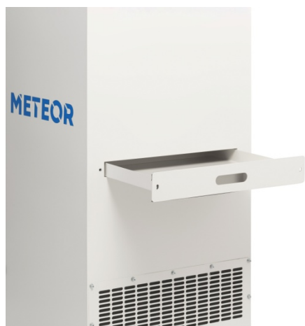
Фото 4: выдвигной лоток-пылесборник