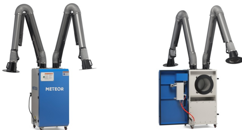
Фото 2. Установка фильтровентиляционная METEOR Profi 3000В с двумя вытяжными рукавами